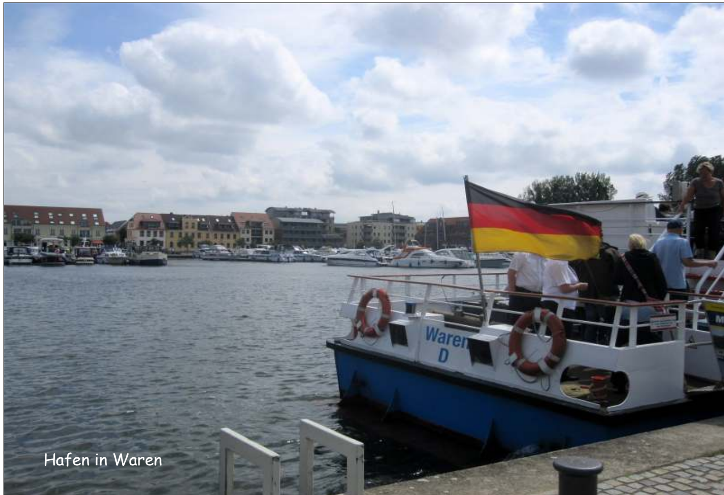
Hafen in Waren