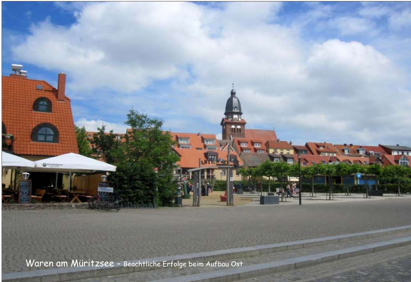
Waren am Müritzsee - Beachtliche Erfolge beim Aufbau Ost