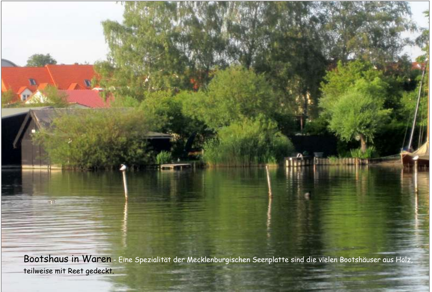
Bootshaus in Waren - Eine Spezialität der Mecklenburgischen Seenplatte sind die vielen Bootshäuser aus Holz, teilweise mit Reet gedeckt.