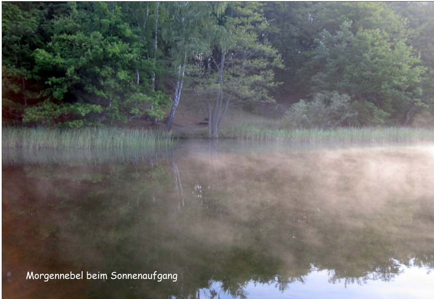
Morgennebel beim Sonnenaufgang